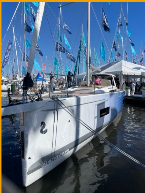
Annapolis Boat Show, Octobre 2024